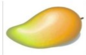
4. m.... ngo