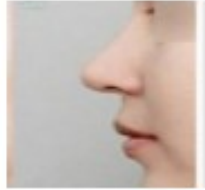
5. n .... se