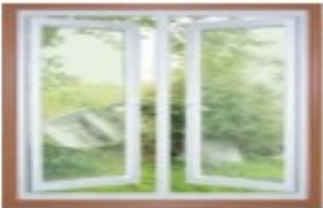
3. w ind ....w