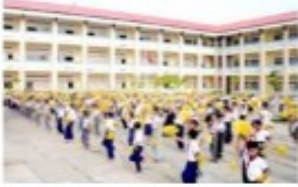
1. sch.... ol